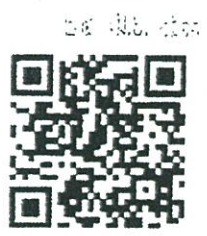
สิ่งที่ส่งมาด้วย ๑ - ๔

สำนักมาตรฐานการทะเบียนที่ดิน ส่วนมาตรฐานการจดทะเบียนสิทธิและนิติกรรม โทร. ๐ ๒๑๕๑ ๕๗๖๒ โทรสาร ๐ ๒๑๕๓ ๙๑๒๔